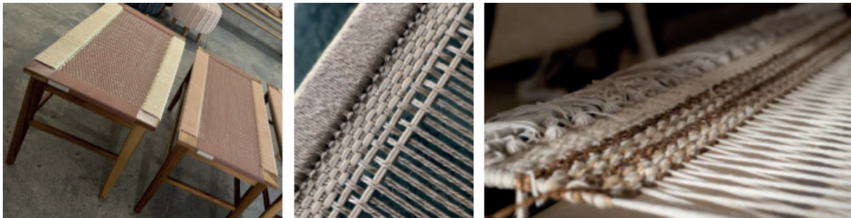
Figura 2 – Produtos feitos com fibra de fique: Casa Trama

A fibra de fique, por exemplo, é amplamente cultivada na Colômbia, onde é utilizada na produção de peças de mobiliário (figura 2). Seu uso tem grande relevância cultural e econômica, especialmente quando trabalhado em teares, pois possibilita a preservação de técnicas artesanais tradicionais, ao mesmo tempo em que valoriza saberes locais e contribui para a geração de renda (Casa Trama, 2025).