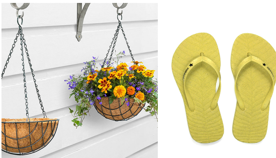
Figura 7 – Aplicações da fibra de coco (em sua forma natural e em compósitos)

As fibras de coco apresentam coloração uniforme, elasticidade, durabilidade e resistência à tração e à umidade, possibilitando seu uso como matéria-prima natural ou em compósitos (CropLife Brasil, 2020; GiraldeLLi et al. , 2021; Nunes, 2021). Essas propriedades reduzem a dependência de materiais não renováveis e reforçam sua importância para a produção sustentável em diferentes setores.