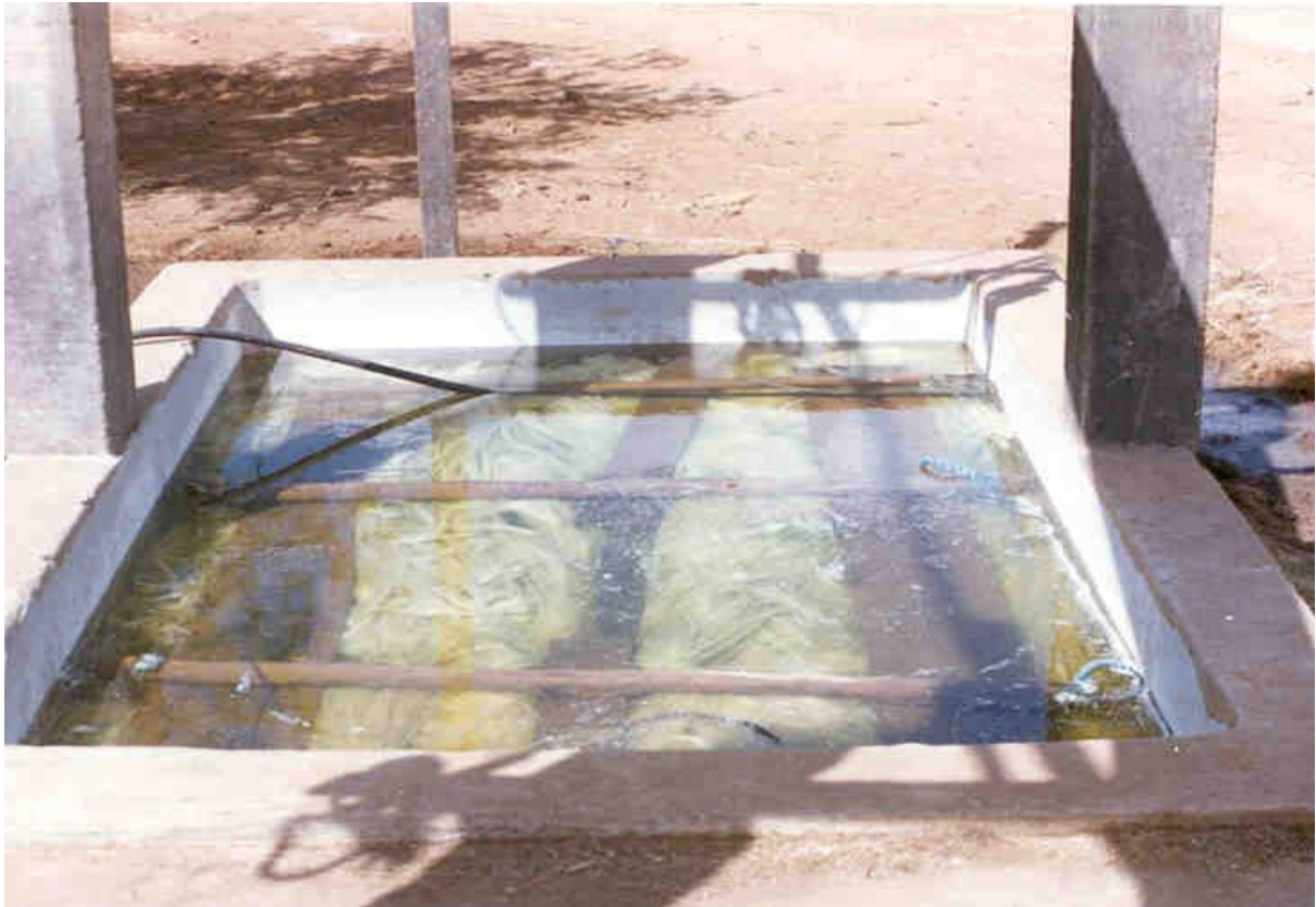
Figura 4 – Processo de extração do Sisal