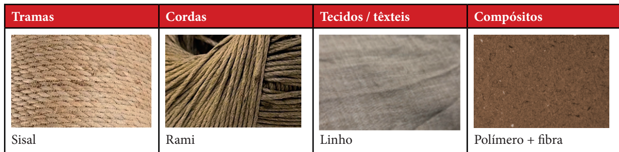
Figura 1 – Transformações das fibras naturais