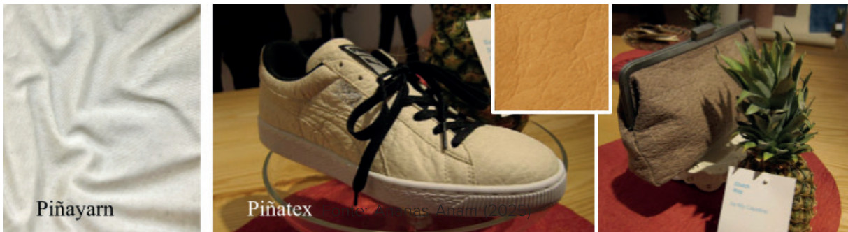
Figura 3 – Piñayarn e Pinatex

A fibra das folhas do abacaxi também apresenta potencial para aplicação em materiais compósitos, como o Piñatex, composto por 72% da fibra, 18% de PLA (ácido polilático), 5% de Bio-PU (poliuretano biológico) e 5% de PU (poliuretano). Esse material surge como alternativa aos convencionais, com aplicações (figura 3) em produtos como tênis (Puma) e bolsas (Ally Capellino) (Ananas Anam, 2025).