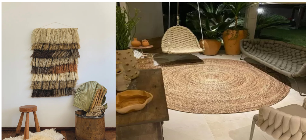
Figura 5 – Aplicações do sisal em produtos