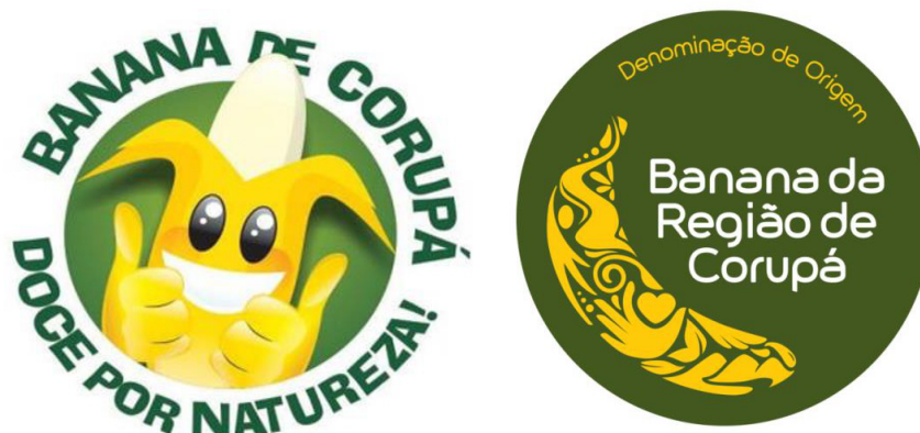
Figura 1 – Bananico e identidade visual da denominação de origem

Além disso, segundo a Asbanco (2016), demais apoios e ações eventuais são mencionados na rede, tais como aqueles realizados pela Prefeitura de Corupá, pelo Clube Bananalama e pela agroindústria, comércio e turismo de Corupá, e a comunidade em geral enfatiza sua participação, o orgulho e o sentimento de pertencimento ao utilizar logotipos, slogans e imagens, como a representação do Bananico, mascote da bananicultura no município de Corupá, e a identidade visual da denominação de origem, um mosaico que representa aspectos e características dos quatro municípios que integram a região de Corupá (figura 1).